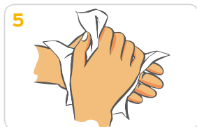
Hände gründlich mit einem Wegwerfhandtuch abtrocknen.