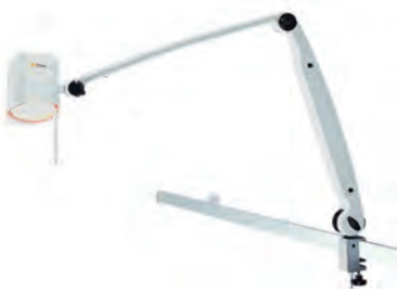
Gegenspiegelleuchte „Halux“ 35 F