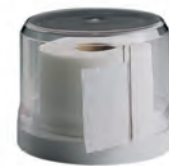
Spender für Zungenläppchen