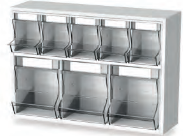
Injektionsset PicBox® multi