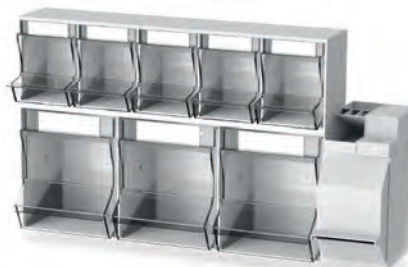
Injektionsset PicBox® Plus