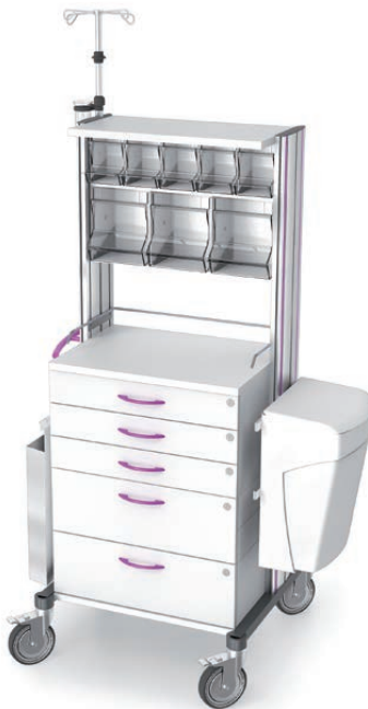
swingo® 60 in Holz-/Kunststoff Behandlungswagen