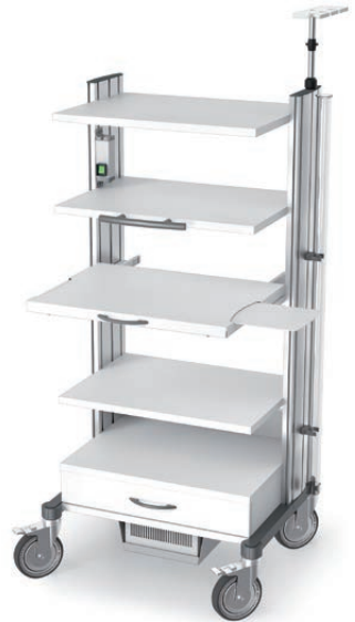
swingo®-clinic 60 in Metall Endoskopiewagen 60.2