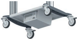
Unterbau-Trenntrafo RU 1120