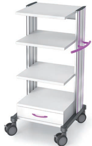
swingo®-clinic 45 in Metall Gerätewagen